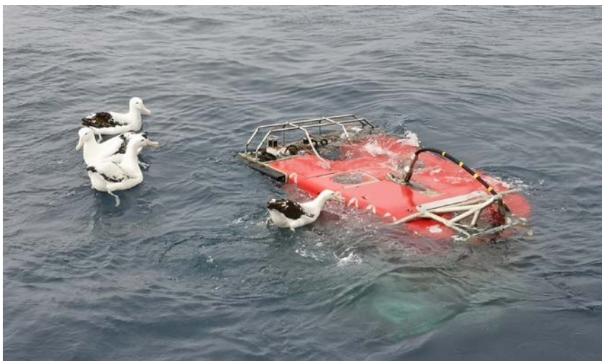
Das ROV "Quest" des Bremer MARUMs kurz vor dem Abtauchen. Ein Schwarm neugieriger Albatrosse, die uns seit dem Auslaufen aus Kapstadt begleiten, verfolgt das Geschehen mit großem Interesse. Ein besonders mutiger der Gruppe testet den Geschmack des ROV QUEST.

Vom südlichen Indik, 15. März 2020, 44° 18.3' S / 38° 15.2' E wünschen wir allen daheimgebliebenen starke Nerven und eine gute Gesundheit.